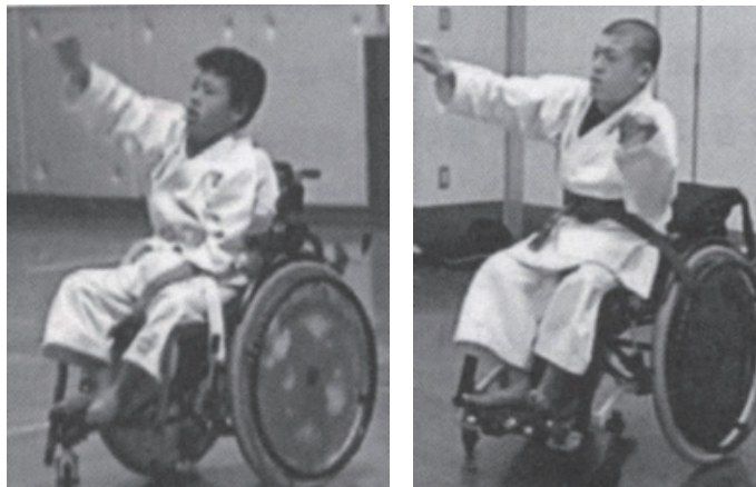
以前から稼働領域が大きかった右腕が、円を描く掛け受けも出来るようになった。(6年前の写真)