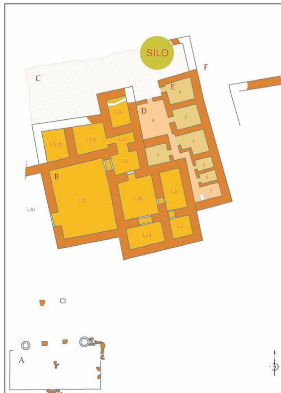
Fig. 1 : Mishirfeh, Chantier C, plan schématique du petit Palais sud.

M. Yon : «Note sur la sculpture en pierre», Arts et industries de la pierre , éd. M. Yon, pp. 345–352, Paris (= RSOu VI).