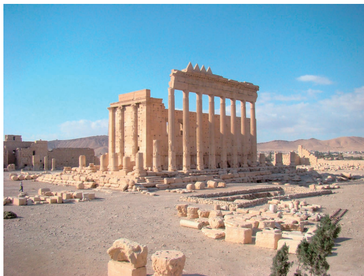
Fig. 1 : Palmyre, Localisation du sondage stratigraphique à l'est de la calla du sanctuaire de Bêl.

Feyssal ABDALLAH : Palmyre dans le complexe économico-politique du XVIII e siècle av. J.-C., AAAS , XLII, pp. 131–135 (=Actes du Colloque Inter. sur Palmyra and the Silk Road , éd. Adnan BOUNNI, Palmyre 7–11 avril 1992).