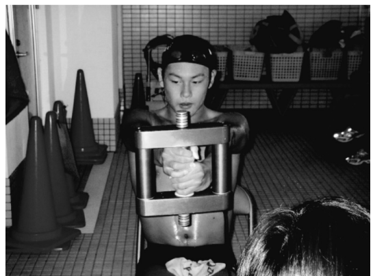
図 3 muscle vibration device (Galileo Up-X Dumbell, Novotec Medical GmbH, Pforzheim, Germany)