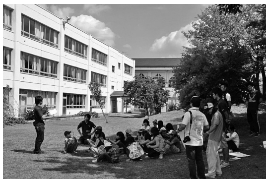
写真3 小学校施設内「冒険の丘」での活動の様子