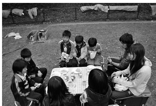
写真5 班ごとの朝食の様子