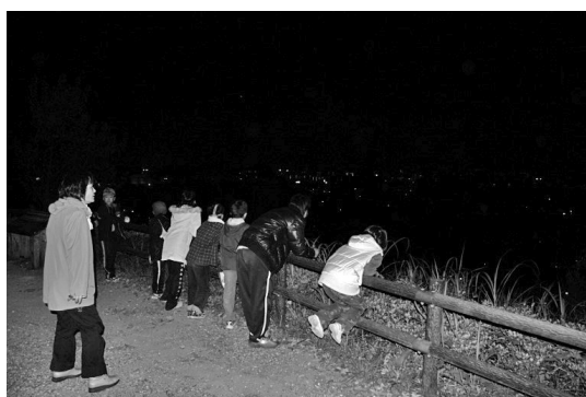
写真2 町の夜景をよこやまの道から眺める