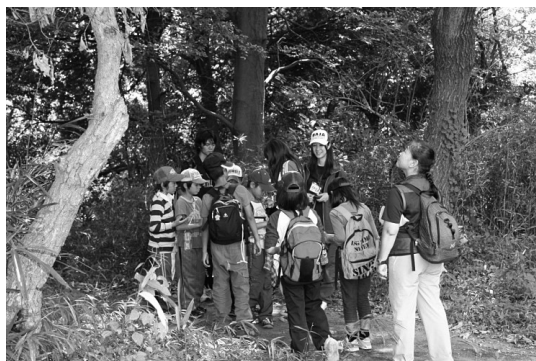
写真1 よこやまの道での環境学習の様子

する平屋建ての教室（写真4）には大ホールがあり、40名ほどの人数の雨天時宿泊や静かなプログラム活動の場所に活用できる。写真5、写真6は冒険の丘での食事の様子であるが、班ごとで作っ