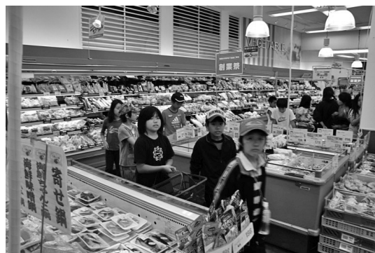
写真9 班ごとメニューを決めて商店街で食材を購入

によるアンケート調査を実施した。アンケートは、多摩の自然学校に対する①「内容・活動」②「指導者」の2項目における満足度評価（満足している－満足していない：10段階評価）と、事業終了後の「参加者における日常生活の変化」（自由記述）、「要望・課題」（自由記述）についての内容で実施した。アンケートの実施は、平成22年10月16日（日）に報告会を開催時に、体験活動中の参加者の様子をDVD上映とキャンプカウンセラー報告を実施した後に行った。報告会に欠席した参加者及びその保護者には、後日郵送にてアンケートを配布し記入後に返送してもらった。