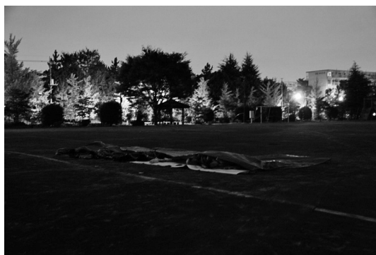
写真8 校庭で夜空を見上げて寝る体験

普段通う学校施設を活動拠点としてプログラムを開発するにあたり、課題となるのは宿泊環境である。今回プログラム開発で利用した多摩市諏訪小学校には雨天時に40名程度が1つの教室で宿泊することが可能な大ホールがあり活用できた。しかし、学校施設で宿泊することは、野外教育という視点から捉えるだけでなく、災害時の緊急宿泊場所としてグラウンドや体育館などで就寝できる仕組みと具体的方法を一般化しておく必要があり、今後の学校施設のあり方として重要といえる。写真8はグラウンドにおいてブルーシート、断熱シート及び寝袋で就寝している様子であるが、夜