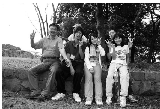
写真10 子どもの活動を支える地域指導者と学生指導者

「内容・活動」の満足度評価において、10点満点中、平均9.8点と高い総合評価を得た。