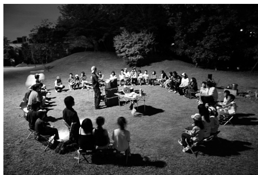
写真6 冒険の丘での夕食の様子（各班で作ったカレーを持ち寄ってみんなで食べる）