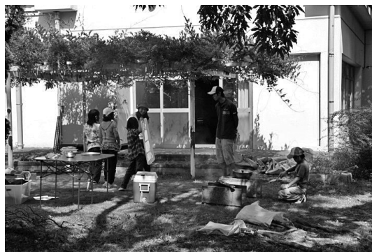
写真4 野外調理場面（隣接する公園に落ちている枯れ木を薪として利用する）