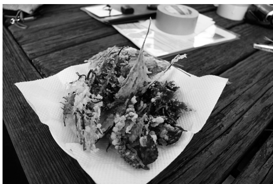
写真7 野草食べる(天ぶら)プログラム

た料理を持ち寄ってみんなで食べるプログラムを行った。写真7は学校施設内や公園に生えている食べられる野草をつかった料理である。学校施設を工夫して活用すれば、長期宿泊に十分に対応でき、身近な自然環境でしか提供できない効果的な野外教育プログラムが可能となる。