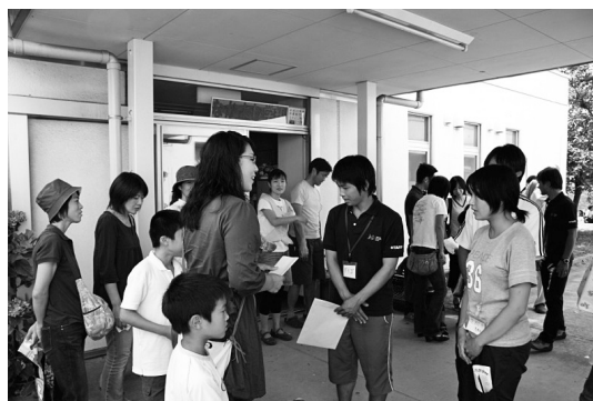
写真11 解散時に保護者に対し子どもの様子を説明する学生指導者