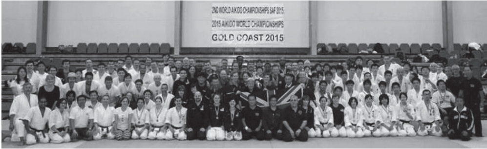
2015年8月30日ゴールドコースト大会会場にて撮影