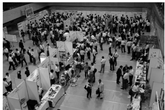
機器展示及びポスター研究発表会場の様子

会組織委員会企画として、2つの学際的シンポジウム、4つのランチョンセミナーが開催され、各会場とも多数の参加者を得た。