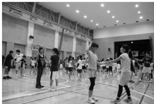
かけっこ教室実技指導

学会大会を開催するにあたり、学校法人国士館、国士館大学体育・スポーツ科学学会からの多大なる支援を戴いた事に深く感謝申し上げる次第である。