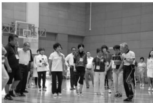
スロージョギング教室実技講習