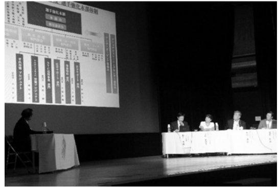
公開シンポジウムの様子

大会組織委員会企画としては、東京地域と連携し公開シンポジウムを2つ開催した。公開シンポジウムⅠでは“1964東京オリンピック”をテーマとし、1964年当時のメダリスト、スポーツ関係者及びスポーツ科学研究者の諸氏に登壇して戴いた。また、公開シンポジウムⅡでは、“2020東京オリンピック・パラリンピック”をテーマに設定し、大会を開催する立場、選手を強化する立場、パラリンピックメダリストの立場及びスポーツ科学研究者の立場からご講演を戴いた。その他の大