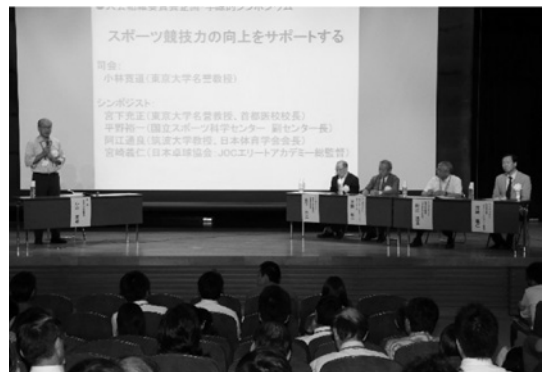
学際的シンポジウムの様子