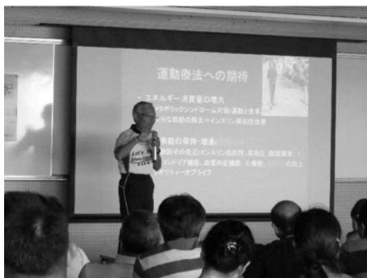
スロージョギング教室での講義

25日に開催されたスロージョギング教室では、スロージョギングの特徴と効果に関する講義と、実践を取り入れた実技講習が行われ、58名の参加があった。26日、27日実施したかけっこ教室には、世田谷区及び神奈川県在住の小学生199名の参加があった。参加者（小学生、成人）の熱心で真面目な受講ぶりや引率保護者の熱意からも、「かけっこ教室」「スロージョギング教室」に対する需要が高いことが感じられた。